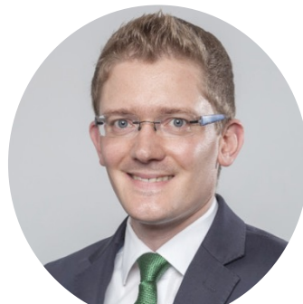
Simon Lennert Leistritz AG